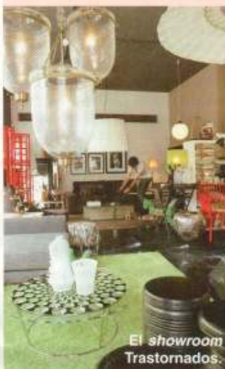
El showroom Trastornados.

En la web hemos probado en persona los mejores spas. Búscalos en el canal Estar bien.