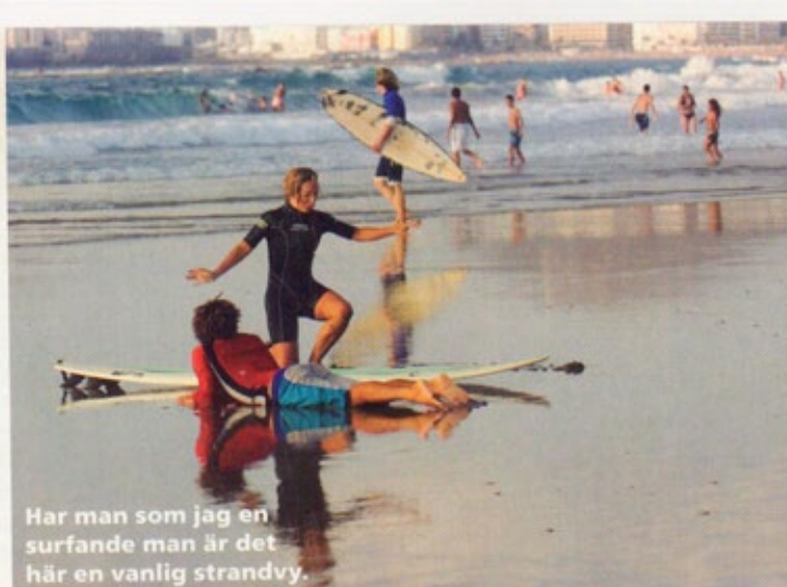
Har man som jag en surfande man är det här en vanlig strandvy.

Ålder: 48. Gör: Diverse projekt. Bott i Las Palmas: 44 år.