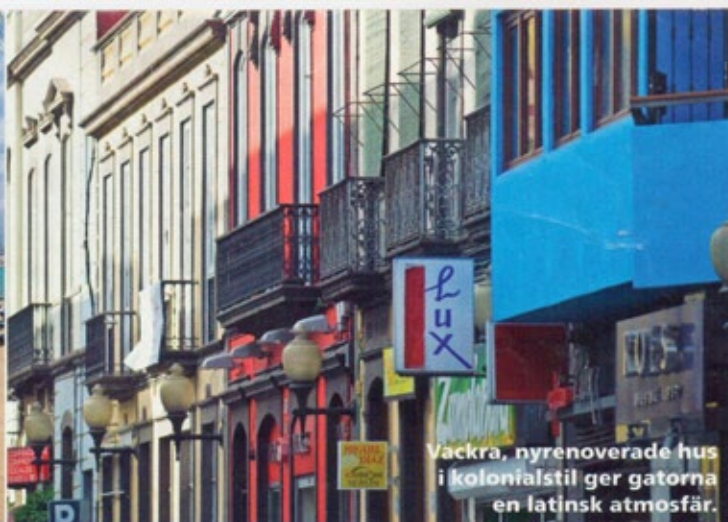
Vackra, nyrenoverade hus i kolonialstil ger gatorna en latinsk atmosfär.