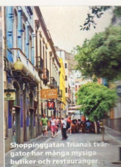
Shoppinggatan Trianas tvärgator har många mysiga butiker och restauranger.