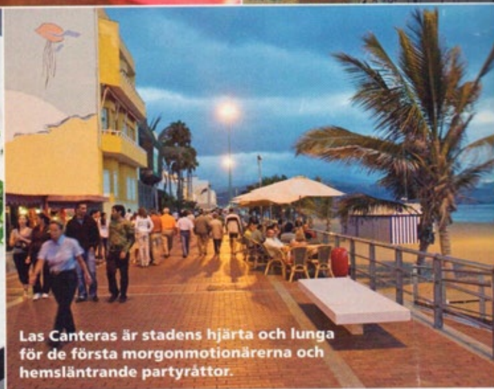
Las Canteras är stadens hjärta och lunga för de första morgonmotionärerna och hemsläntrande partyrätter.