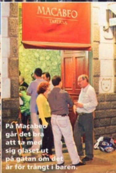
På Macabeo går det bra att ta med sig glaset ut på gatan om det är för trångt i baren.