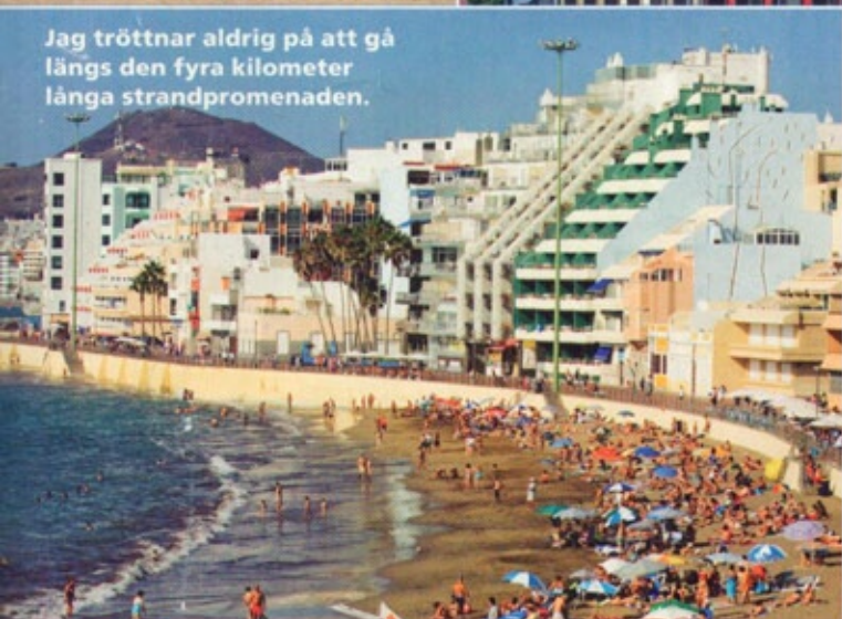
Jag tröttnar aldrig på att gå längs den fyra kilometer långa strandpromenaden.