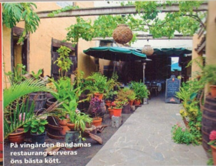
På vingården Bandamas restaurang serveras öns bästa kött.

Mina favoritplatser ligger vid strandens båda ändar. I söder utanför auditoriet där surfarna håller hus och kvarteren nu genomgår en metamorfos. Eller längst upp vid La Puntilla, nära den lil-