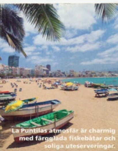
La Puntillas atmosfär är charmig med färgglada fiskebåtar och soliga uteserveringar.