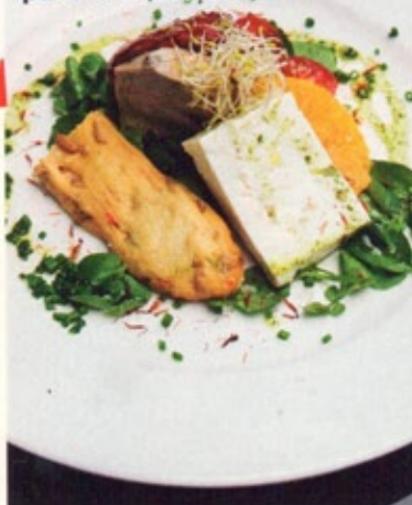
Krogen Agape är en kulinarisk överraskning med mat lagad på lokala råvaror.